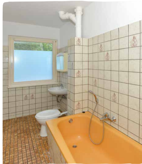
Vorher – nachher: die sanierten Bäder in der Siedlung sind kaum wiederzuerkennen. Heute sind sie hell und modern ausgestattet.